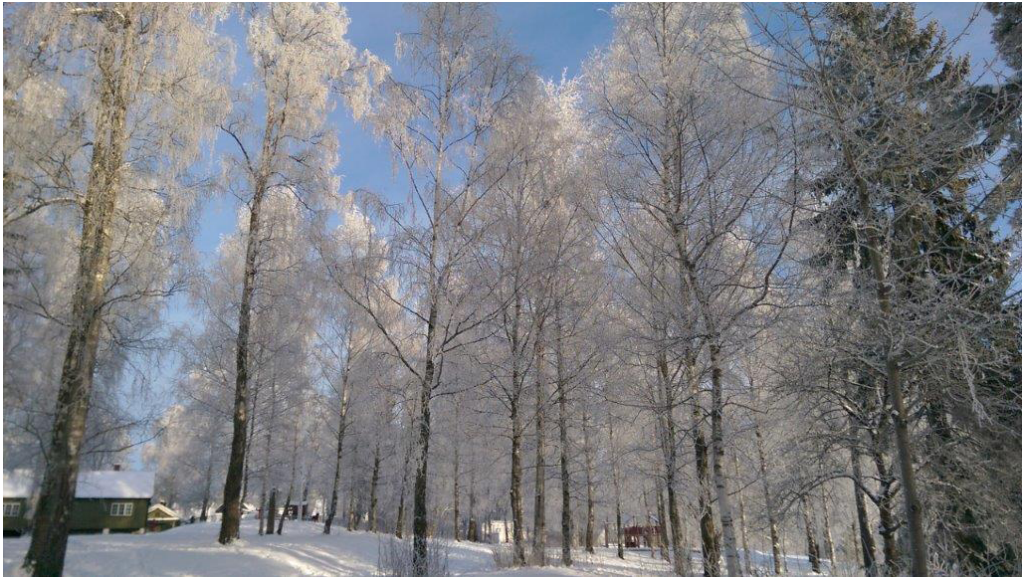
Bjerkelunden i vinterstemning.

Skaujordveien 14 Skaujordveien 15 Skaujordveien 13 Skaujordveien 32 Skaujordveien 34