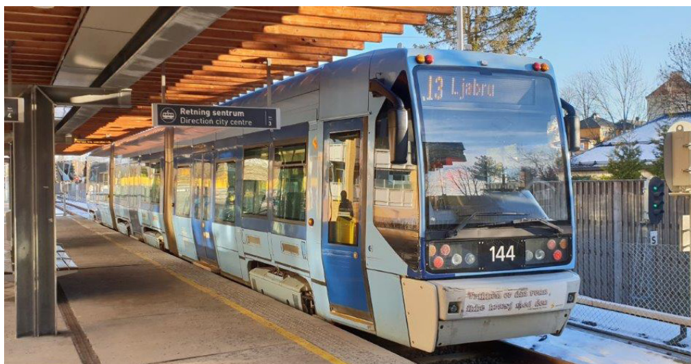
Blåtrikken på Bekkestua stasjon.

Mandag 9. mai 2022 kl. 1900 Bekkestua Bibliotek, Bekkestua