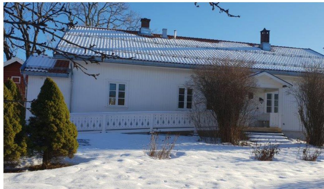
Presterud Gård, Bekkestua