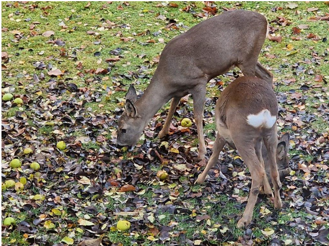
Rådyr i Egnehjem hage på jakt etter epler

Onsdag 24. april kl. 19.00 på Presterud gård (nabo til den internasjonale skole)